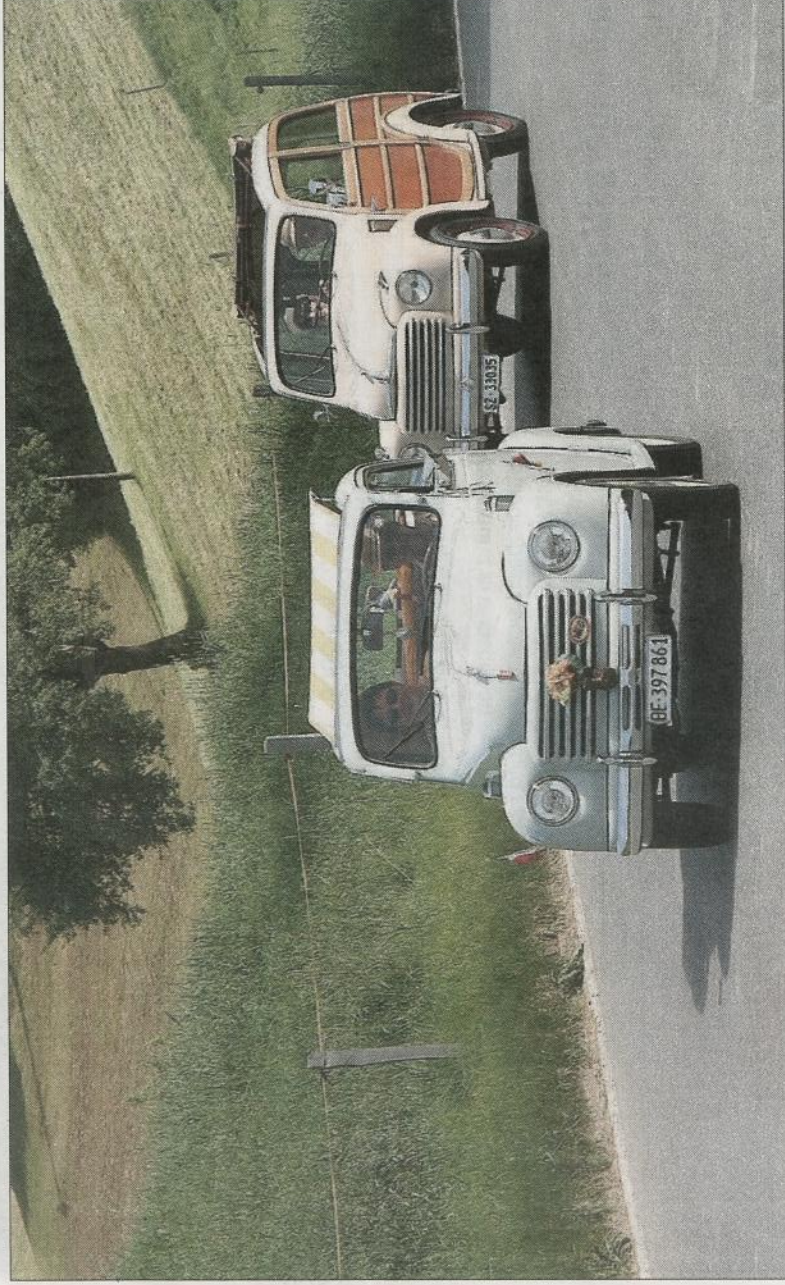
Auf der Fahrt Richtung Finsterwald.